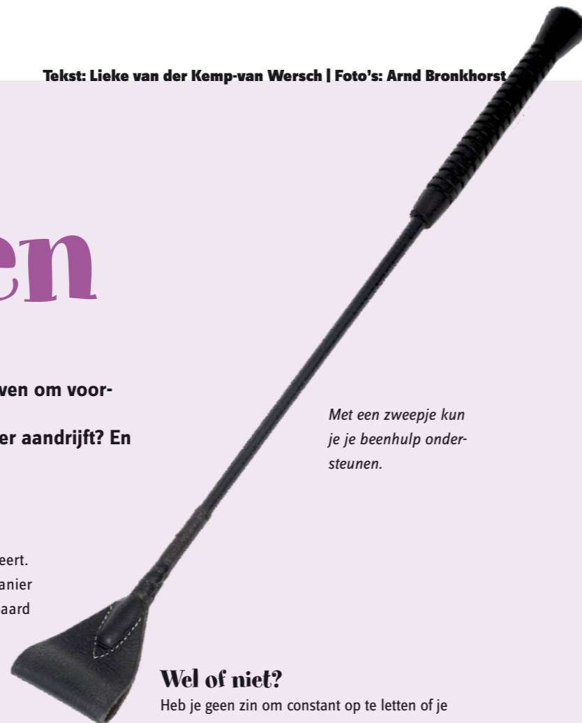
Met een zweepje kun je je beenhulp ondersteunen.

Heb je geen zin om constant op te letten of je pony goed luistert, bijvoorbeeld tijdens het uitstappen bent, drijf dan niet aan. Het paard kent geen verschil tussen aandrijven om wél te luisteren en aandrijven om niet te luisteren. Je moet heel streng zijn, vooral voor jezelf: drijf alleen aan als je wilt dat je pony reageert!