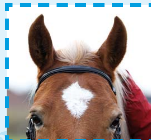
Bij een te kleine maat hoofdstel is de frontriem te smal en kruipt deze omhoog.