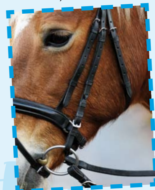
Bij dit hoofdstel zijn de bakstukken duidelijk te lang.