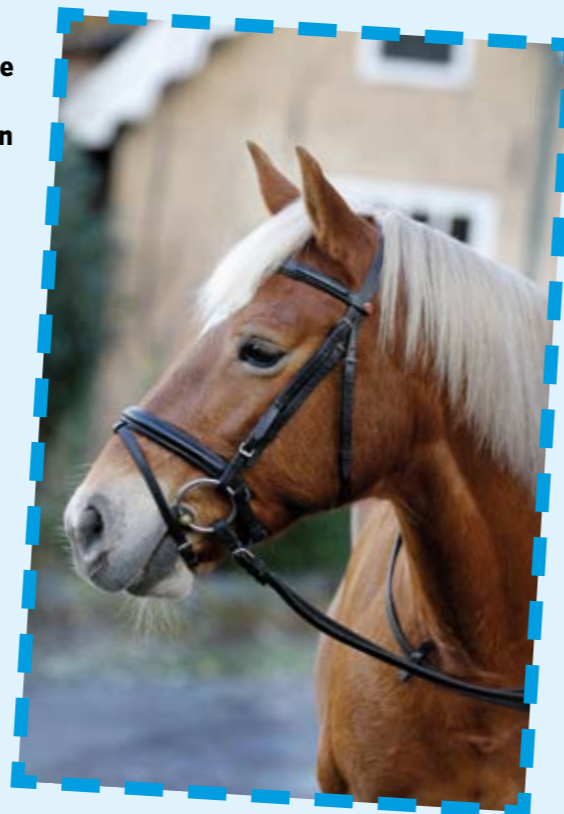
Zo hoort een hoofdstel te zitten.

Een te groot bit wordt door de ruiter door de mond getrokken en steekt - ook als je niets doet - aan beide kanten een stukje uit. Bij elke teugeldruk wordt het bit eerst door de mond getrokken, voordat het aan de andere kant weer aansluit. Dat is voor een paard of pony niet prettig, soms doet het pijn en daar-