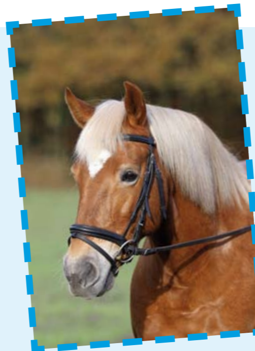
Deze neusriem zit te laag. Vaak zie je ook dat een neusriem te los zit en omlaag getrokken wordt door de sperriem.

door luistert je paard minder goed. De oplossing is een passend bit te kopen of lenen. Soms kun je ruilen met iemand anders. Laat je adviseren voor je iets koopt, neem je oude niet-passende bit mee en vraag of je kunt ruilen als het nieuwe bit niet de juiste maat heeft. Een te klein bit komt gelukkig niet zo vaak voor, maar je zult heel snel merken als een bit veel te strak in de mond van je paard of pony zit.