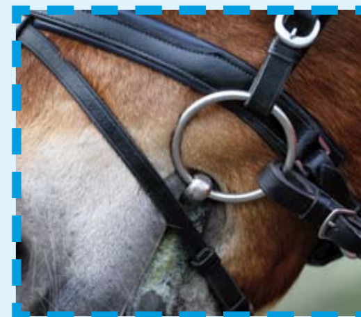
Dit bit is te klein en ook nog eens te strak omhoog getrokken.